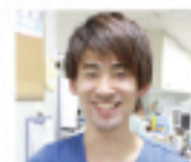
ICU勤務 4年入職 専門看護師資格取得中

就職説明会で菊名記念病院の話を聞く機会があり、救急車の受け入れが多く、さまざまな疾患を持った患者様と向き合える環境で看護師として成長したかったという点から、この病院を選びました。ICUでは厳重なモニター管理、さまざまなME機器に囲まれ、入職当初は緊張の連続でしたが先輩たちが些細な事でも一つひとつ段階を退って丁寧に教えてくれたことをとても感謝しています。私も4年目になりますが、これからの私に何が求められるかを考えると、後輩への教育だと思っています。自分が今まで先輩から学んできたことを、今度は後輩たちに還元していきたいです。