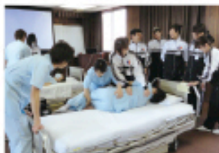
リハビリテーション科との合同研修

また、専門、認定看護師教育課程受講の支援規定(身分保障、奨学金など)のほか、各資格認定取得を応援しており、多くの資格取得者が当院で活躍しています。