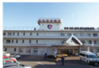
救急車が頻りに出入りします

東急東横線で渋谷まで20分、横浜まで10分と都心へのアクセスは抜群です。また、羽田空港まで40分、新幹線「新横浜」駅は菊名駅の隣駅ですので、帰省の時も大変便利です。